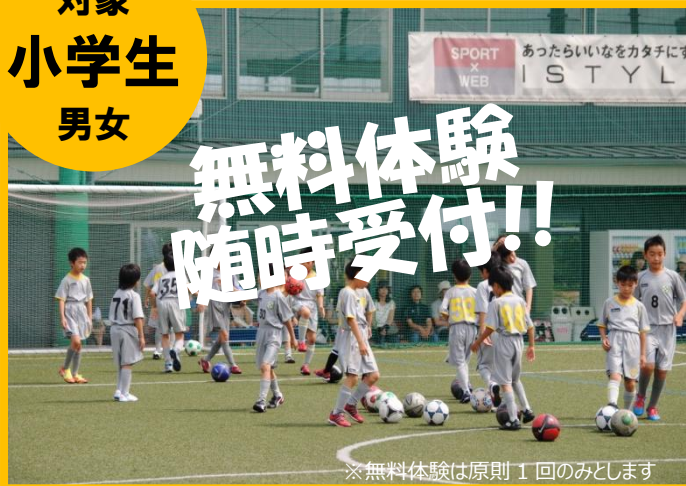
※無料体験は原則 1 回のみとします