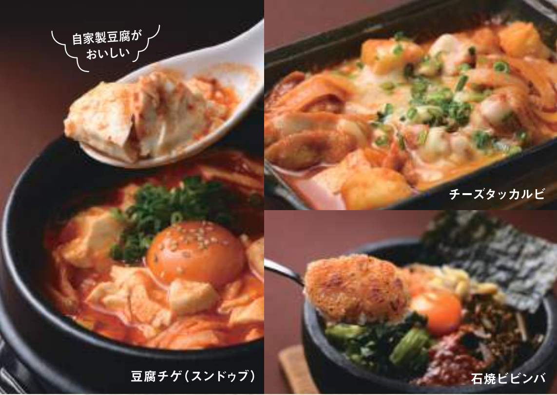
豆腐チゲ(スンドゥブ)