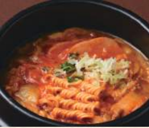
チヂミ 乾麺入り 600円