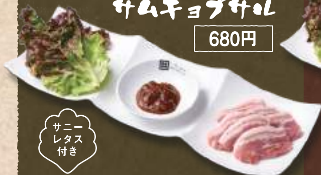
サムギョプサル 680円