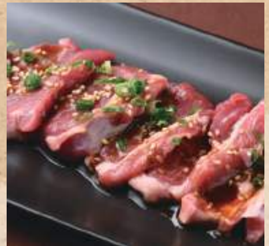
みずすめ ラム タレまたは塩