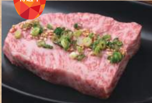
黒毛和牛ロース 1,780円