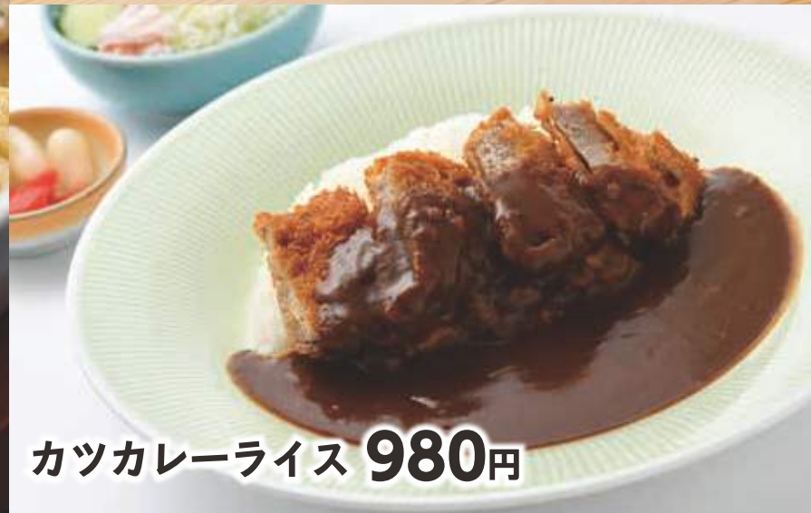
カツカレーライス 980円