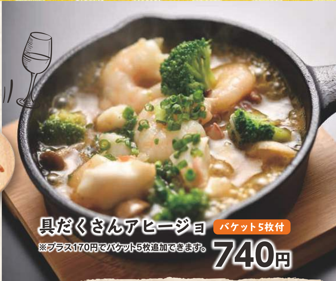
具だくさんアヒージョ 740円 ※プラス170円でバケット5枚追加できます。