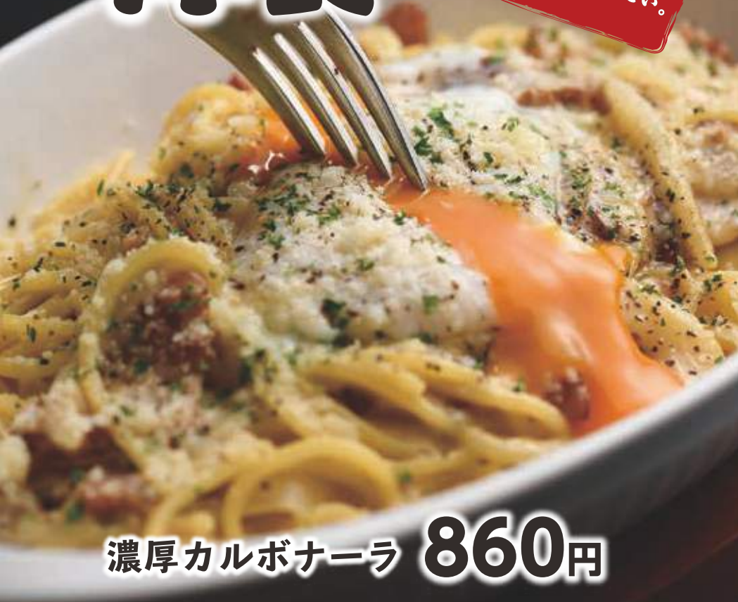
濃厚カルボナーラ 860円