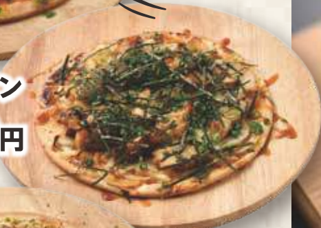
照り焼きチキン 740円