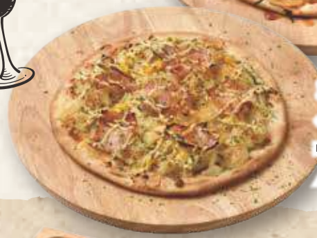
ポテマヨベーコン 740円