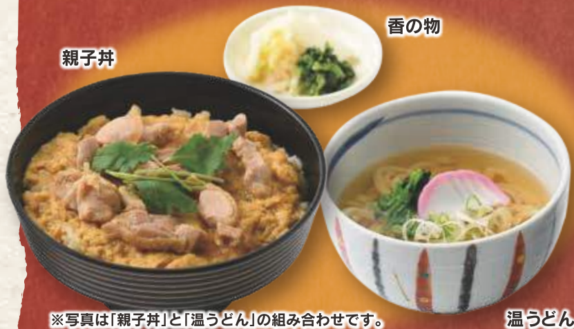
※写真は「親子丼」と「温うどん」の組み合わせです。