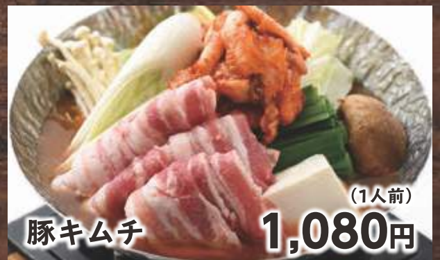
豚キムチ (1人前) 1,080円