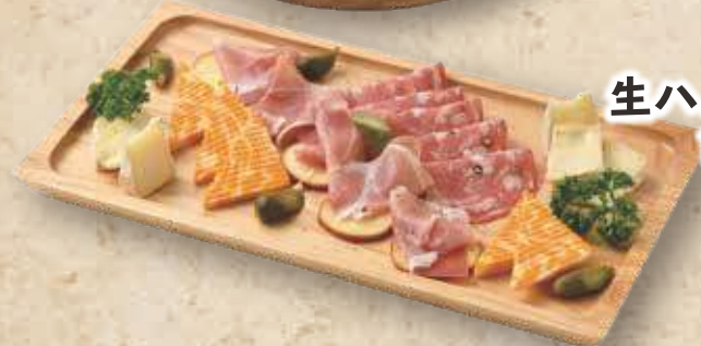
生ハムとチーズ色々盛合せ 980円