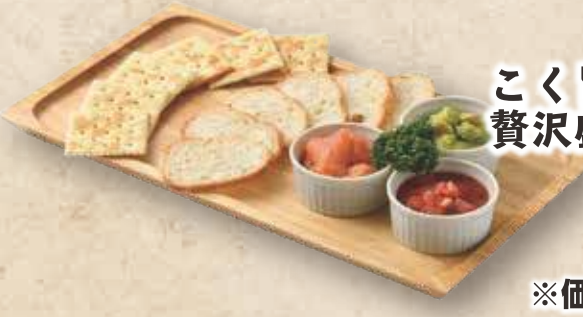
こく旨ディップの贅沢盛り (クラッカー・バケット付) 860円