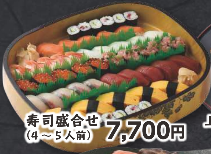
寿司盛合せ (4~5人前) 7,700円