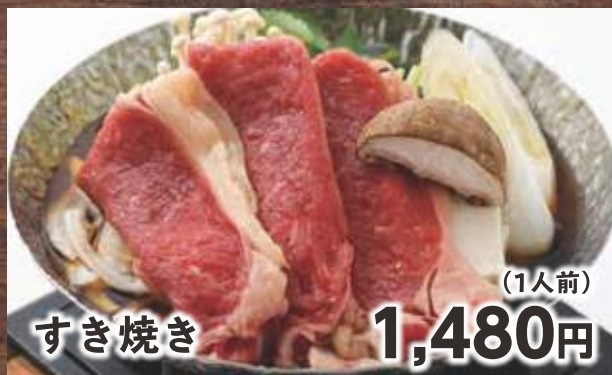
すき焼き (1人前) 1,480円