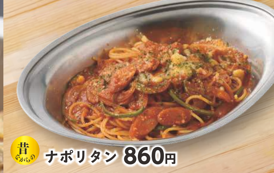
昔ながらの ナポリタン 860円