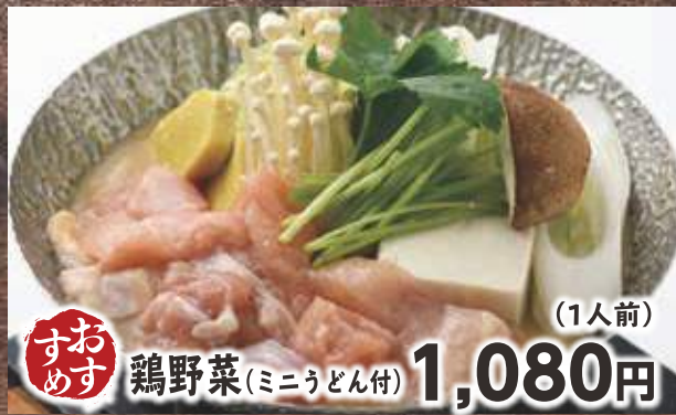
鶏野菜 (ミニうどん付) 1,080円