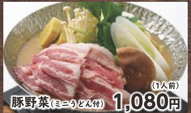
豚野菜 (ミニうどん付) 1,080円